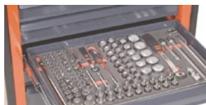
Може вміщати інструмент в ложементх TOOL system