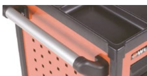
Міцна ручка на бічній поверхні