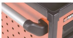
Захищені від удару грані