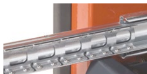
Телескопічні направляючі на шарнірах