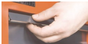
Розблокування і відкриття, а також закривання і блокування полки виконується однією рукою