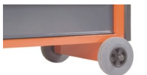
Гумові колеса не залишають слідів на підлозі