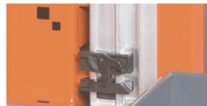
Обмежувач ходу не дозволяє полиці перекидатися