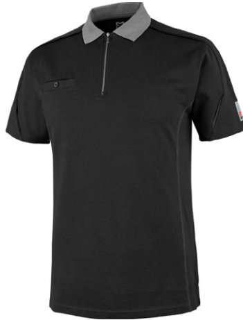
чорний M447644 ...