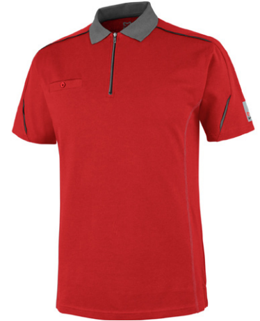
червоний M447645 ...