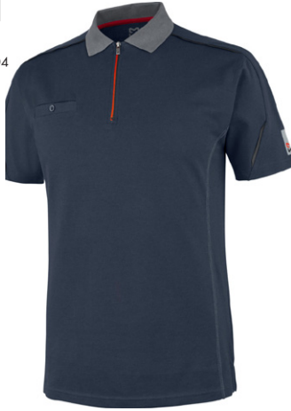
темно-синій M447513 ...