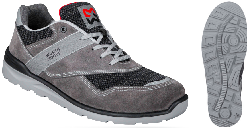
темно-сірий M427015 ...

Зручне й легке робоче взуття з нековзкою підошвою. Повсякденний невимушений образ.