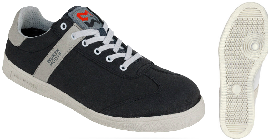
чорний M427011 ...

Надзвичайно легка робоче взуття приголомшливого дизайну, що забезпечує відмінну стійкість на слизькій поверхні.