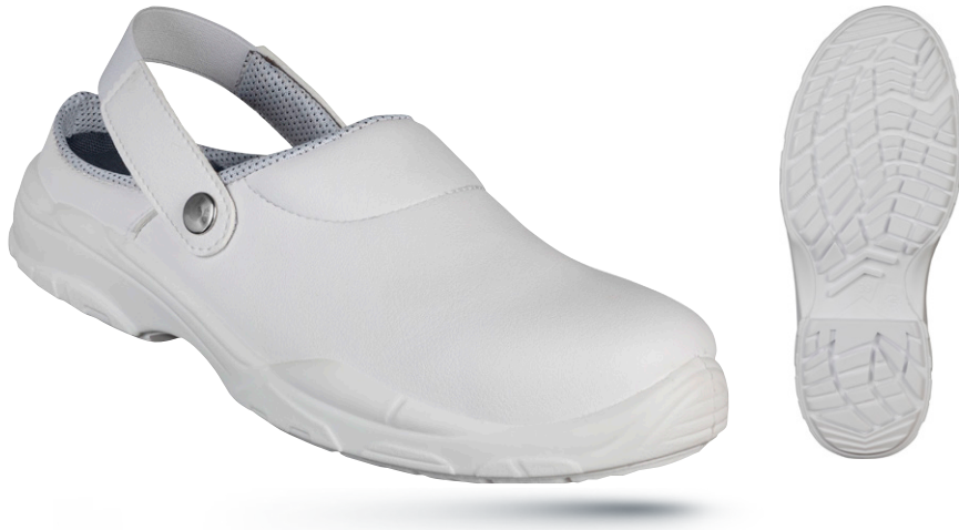
білий M414009 ...

Сліпери SB не тільки зручні, але й легко і швидко взуваються й знімаються. Вони підходять для універсального використання і забезпечують вашим ногам відчуття комфорту.