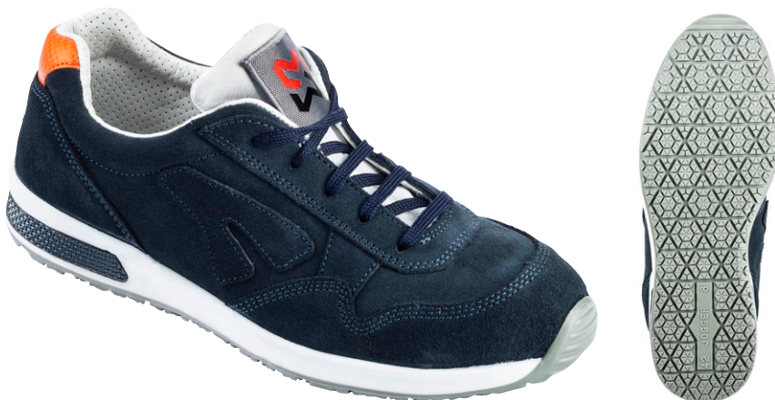
синій M015038 ...

Надзвичайно легке захисне взуття поєднує спортивний дизайн з високим комфортом. Особливо підходить для роботи в сухих приміщеннях.