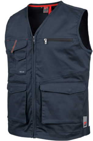
с M402119 ...