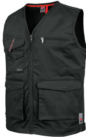
антрацит M402118 ...