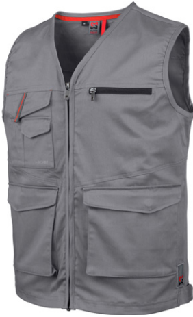
сірий M402117 ...