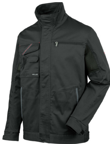
антрацит M401251 ...