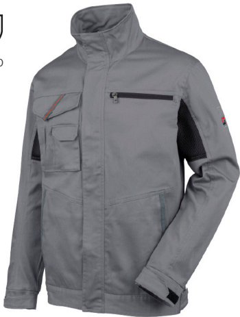
сірий M401250 ...