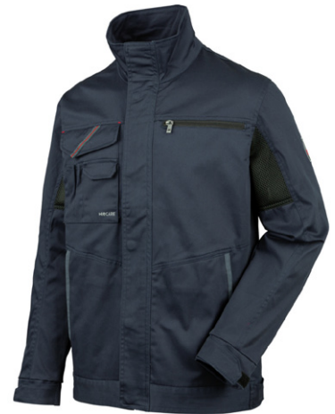
синій M401252 ...