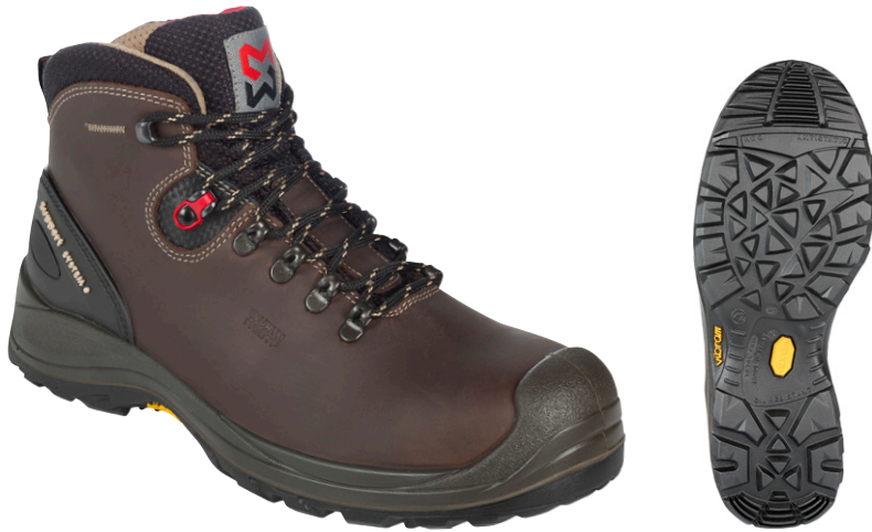
коричневий M322022 ...

Міцні захисні черевки з жаростійкою підошвою Vibram, яка витримує температуру до 300° впродовж 60 секунд. Вони вдало поєднують комфорт та захист.