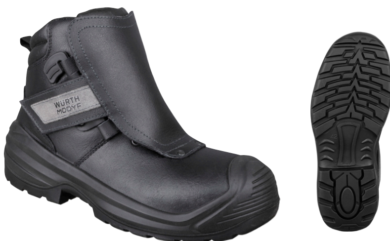
чорний M422178 ...

Міцні черевки з дихаючої і водовідштовхувальної натуральної шкіри з клапаном, що закриває шнурки. Ідеальний варіант для зварювальників.