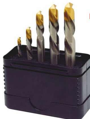
Набір свердел WN тип RN, 5 шт.