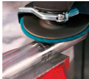
Шліфування зварних швів і видалення слідів на металі.