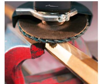
Полірування бронзи і латуні.