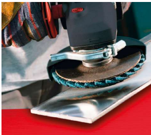
Полірування нержавіючої сталі.