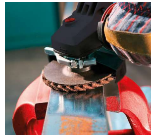
Професійне видалення нальоту та іржі.