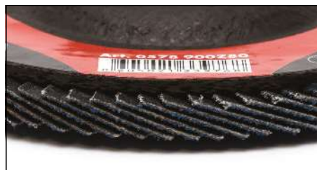
Велика кількість шліфувальних ламелей